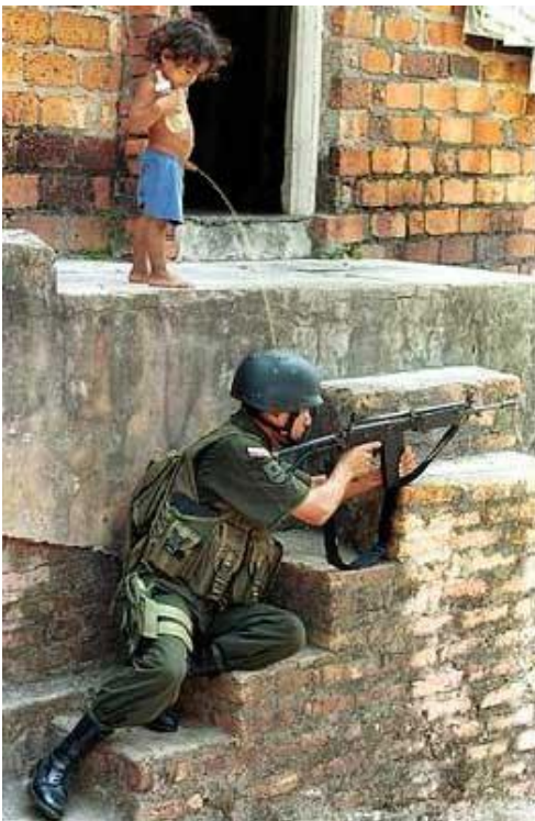
(la guerra che ci piace)

Insomma la bandiera della pace ha vari padri e madri ma la verità innegabile è che è ispirata dall'arcobaleno e che siccome l'arcobaleno annuncia il sole dopo il brutto tempo, lei simboleggia la speranza...LA SPERANZA IN UN MONDO BASATO SULLA PACE E SUL RISPETTO DEI DIRITTI UMANI.